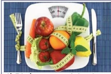
Il Biologo nutrizionista