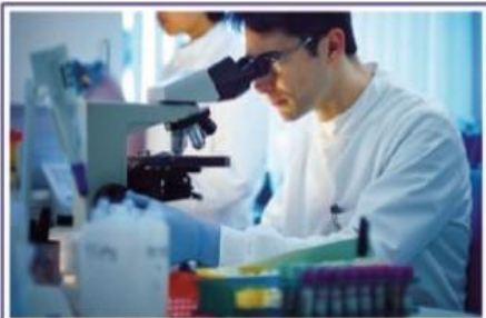
Il Biologo in ambito sanitario