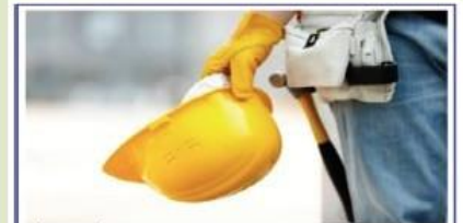
Il Biologo esperto in Sicurezza e Qualità