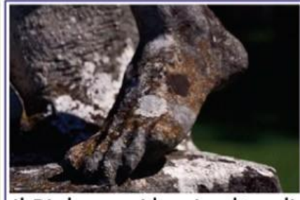
Il Biologo e i beni culturali