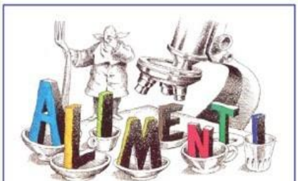
Il Biologo e l'igiene degli alimenti