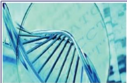
Il Biologo e la genetica forense