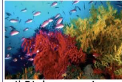
Il Biologo marino