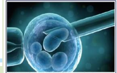
Il Biologo e la fecondazione assistita